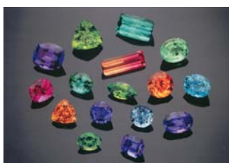
Workshop Edelstenen (1 dag)