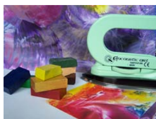
Workshop Bijenwas (1 dag)

Maak een schilderij, een bijenwastekeningen of creëer jouw eigen dreamcatcher. Maak spirituele sieraden zoals een chakra ketting of kristal hanger.