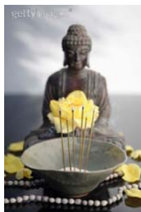
*sfeer foto's gemaakt door Stephany